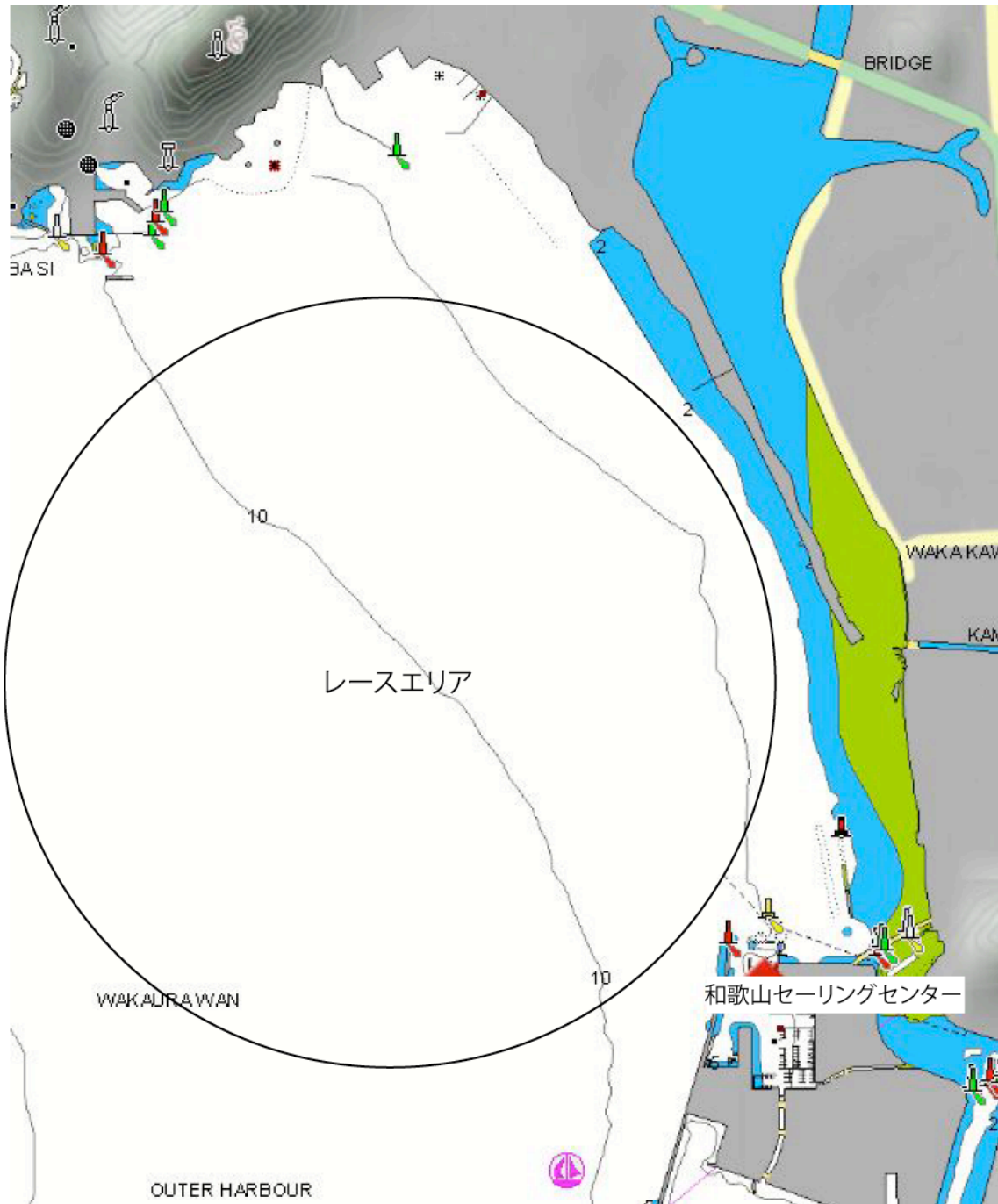
添付図1 ハーバー及びレース・エリアの場所